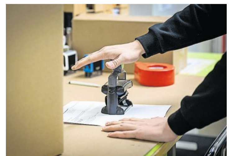
Auch Lieferscheine abstempeln gehört zu den Aufgaben.